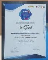
Marketing Branding Award - 2022