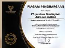
KUR Award - 2021