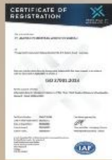
ISO 27001 - 2013