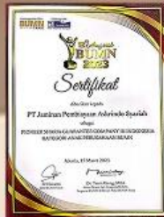
BUMN Award - 2023