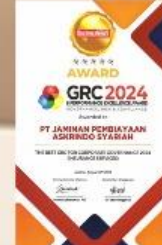
GRC Award - 2024