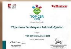
TOP CSR Award - 2018