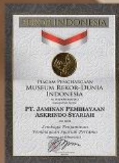
Rekor MURI - 2013