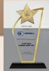
Best Sharia Guarantor Company - 2024