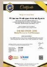
ISO 37001 - 2016