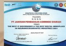
Digitech Award - 2021